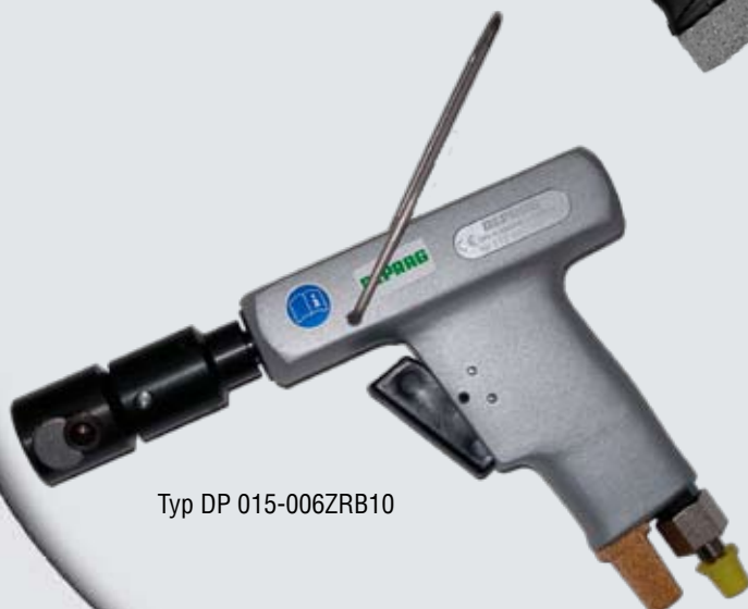
Typ DP 015-006ZRB10