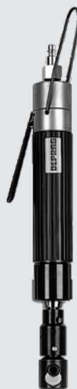
Typ DS 040-007BXR12