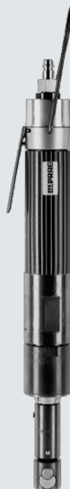
Typ DS 070-003BXR16

Závitorezy DEPRAG INDUSTRIAL do M 14, pro řezný výkon do oceli např. k dořezání do M 16 jsou k dispozici 2 druhy závitorezů: