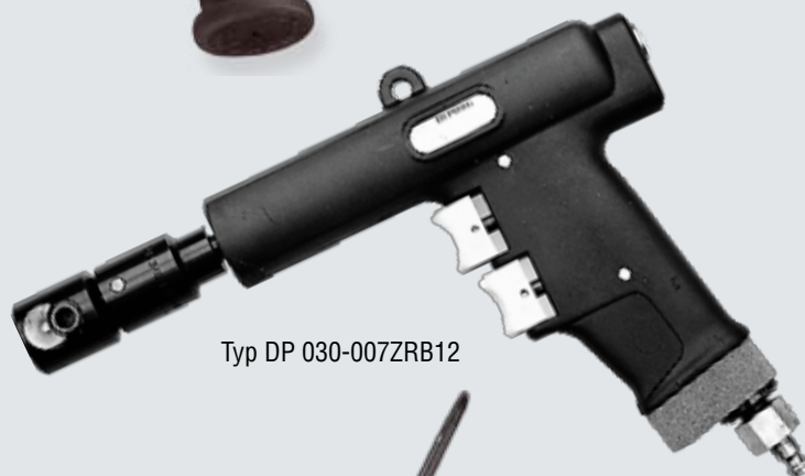
Typ DP 030-007ZRB12