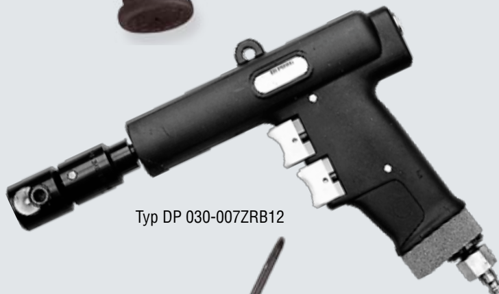
Typ DP 030-007ZRB12