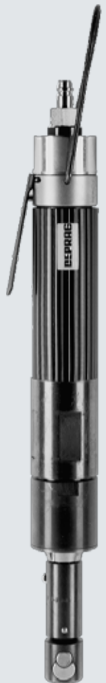
Typ DS 070-003BXR16

DEPRAG INDUSTRIAL Gewindeschneidmaschinen bis M 14, Schneidleistung in Stahl bzw. zum Nachschneiden bis M 16 stehen in 2 Bauarten zur Verfügung: