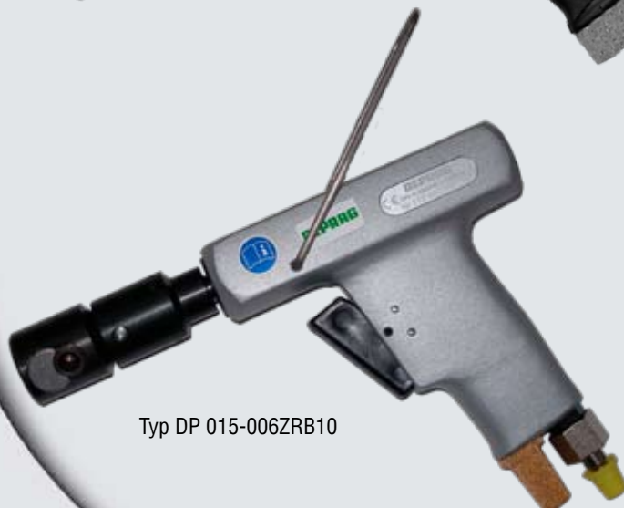
Typ DP 015-006ZRB10